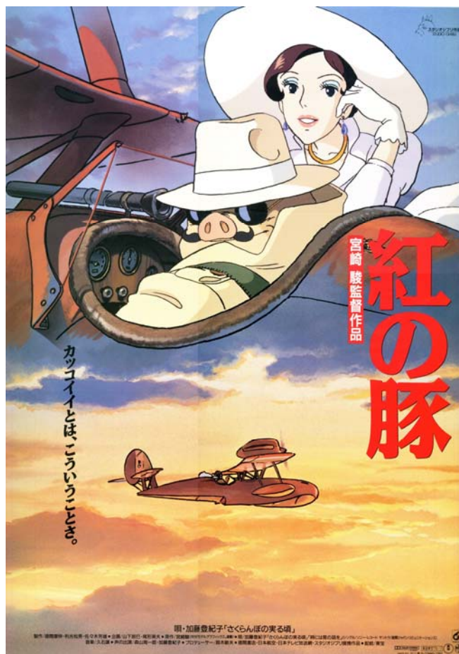
図①：映画『紅の豚』の広告ポスター（スタジオジブリ 1992年）

1992年の映画『紅の豚』の広告コピー「カッコイイとは、こういうことさ。」(図①)は、映画から切り離され、それ自体が人口に膾炙する程度に評価されている。それが名コピーたるゆえんは、いわゆるダンディズムを体現する「豚」のキャラクターの生きざまを代理しているからでもあるが、その身ぶり自体が、まさに「カッコイイ」を体現しているからではないか。すなわち、「カッコイイとは」という、概念の内包を記述する形式をとりながら、当の内包を、「こういうこと」というしかたで映画、あるいは、ポスターの絵、つまりは、イメージへと投