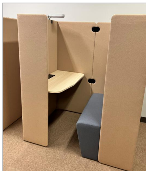
セミオープンブース →