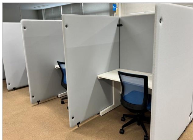
↑ フォーカスブース

どちらも予約不要で利用できます。各席に電源タップがあり、PCでの作業もできます。